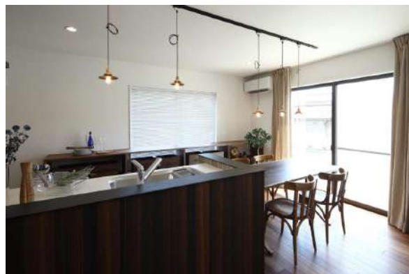
ダイニングキッチン | 広さと採光がしっかり取れる開放的で明るい空間。