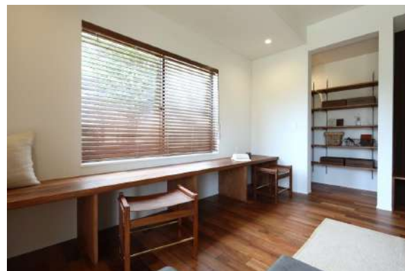
ベンチ | 座っても良いし、寝転がっても良い、日向ぼっこにも最適なスペース。そして机代わりに使えば、ちょっとした書斎スペースとしても活用できます。